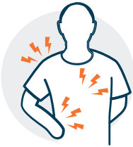
Dolores musculares o corporales