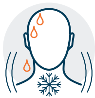
Fiebre o escalofríos