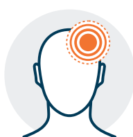
Dolor de cabeza