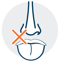
Pérdida del gusto o del olfato

Los síntomas comunes del COVID-19 incluyen 1 :