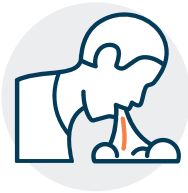
Náuseas o vómitos