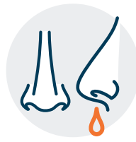
Congestión o secreción nasal